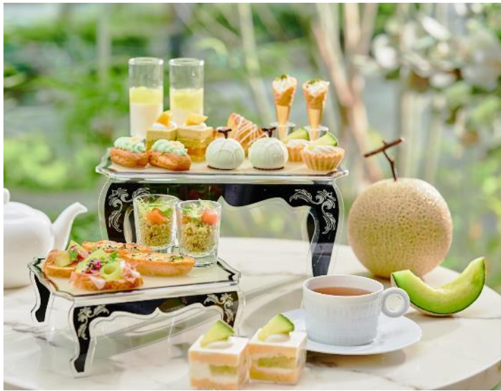
甘く芳醇な香り漂うメロン尽くしのアフタヌーンティー

ザ スtrings 表参道(所在地：東京都港区北青山3-6-8、総支配人：山田弘之)では、1階「Cafe & Dining ZelkovA(カフェ&ダイニング ゼルコヴァ)」にて、甘く芳醇な香りが広がる旬のメロンを贅沢に使用した『メロンアフタヌーンティー』と、ご自宅でもお楽しみいただける『スtrings テイクアウト メロンアフタヌーンティー』、『スtrings テイクアウトハイティー』を、2021年6月3日(木)～9月2日(木)まで販売いたします。