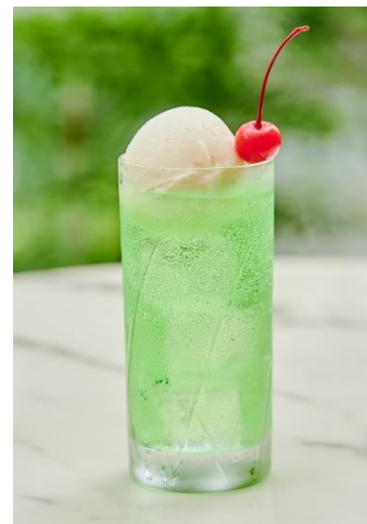
昔懐かしいメロンソーダ(オプション)

※写真はイメージです。ティーカップなどの食器はテイクアウトセットに含まれません。