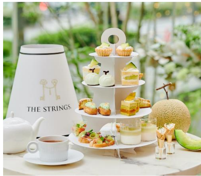
ご自宅で楽しむテイクアウトアフタヌーンティー

甘く芳醇な香りが広がる旬のメロンをふんだんに使用した贅沢なアフタヌーンティーをご用意いたしました。