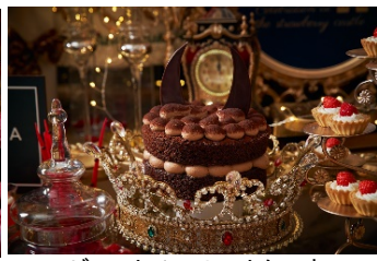
ビーストチョコレートケーキ