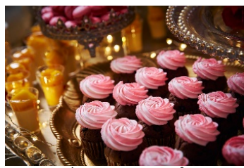
ローズチョコレートカップケーキ