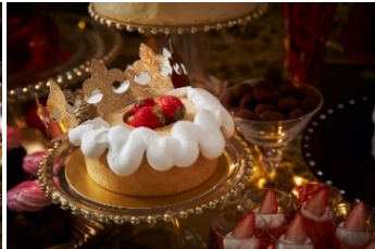
幸せ王子のパウムクーヘン