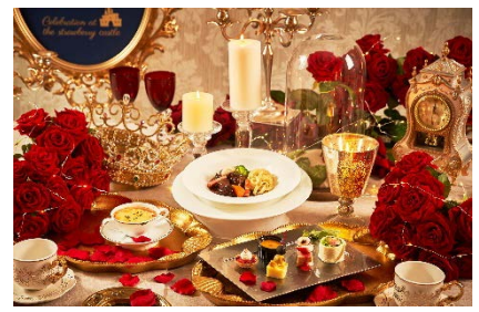
アップグレードコース(ディナー)イメージ