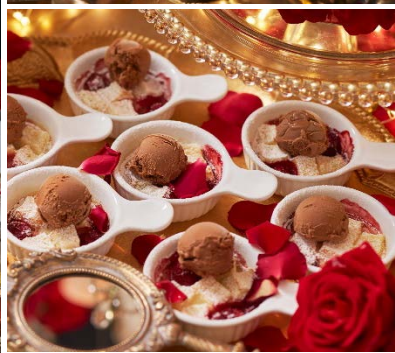
ART OF TEAとコラボレーション(上) タイムサービス莓のパンプディング(下)