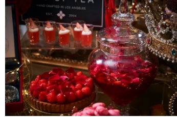
beautyストロベリースープと 真実の愛の苺タルト