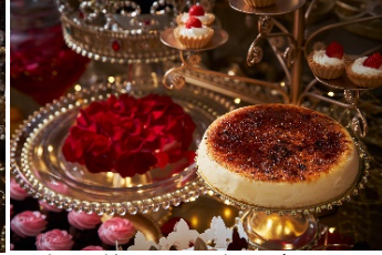
魔法の鏡キャラメリゼチーズケーキと 魔法のバラが散る前に！ 苺ムース