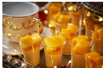
ドレスのカラーのマンゴープリン