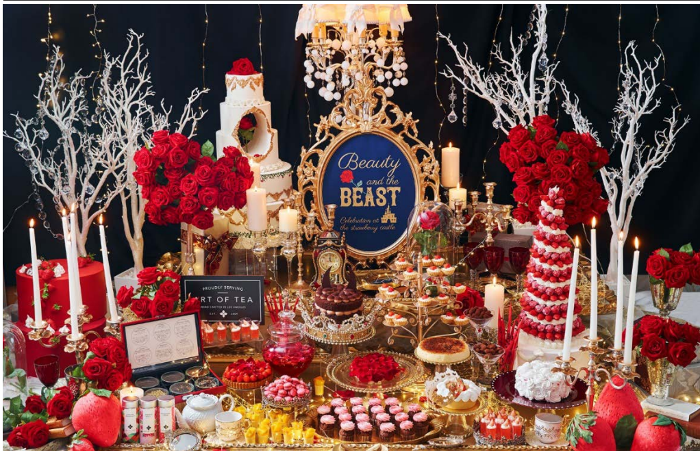
「美女と野獣」の華やかで優雅な世界観の中で数々のスイーツを楽しむ