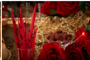
呪いにかげられたアーモンドショコラと 野獣のチョコレートスティック