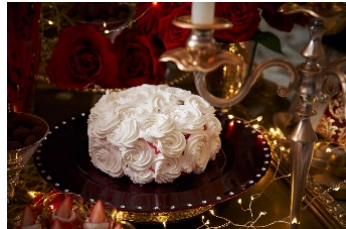
レッドベルベットケーキ