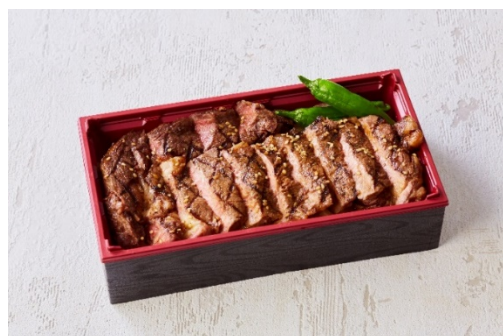
匠 特製ステーキ重