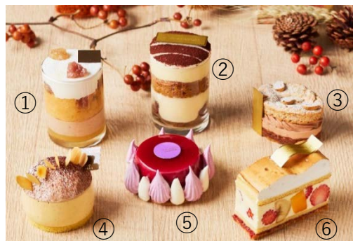
①サヴァラン マロン ポワール ④ブラリネ パッション ②ティラミス ⑤バシュラン カシス ③ダコワーズ シトロン ショコラ ⑥グエル

フレッシュのバナナ、苺、マンゴー、ラズベリーをヴァニラクリームとともにアーモンドのスポンジでサンドした「萌え断」なケーキ。