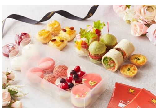
アフタヌーンティーセット(2名様分)