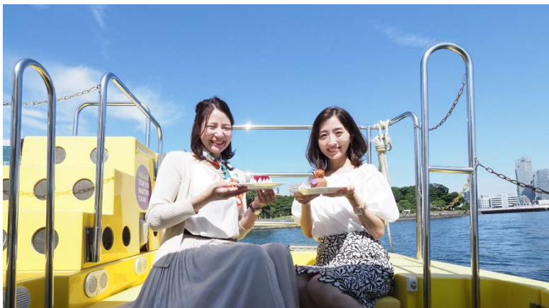
ホテルメイドのスイーツを持ち込んで優雅に水上ティータイム

ホテル インターコンチネンタル 東京ベイ(所在地:東京都港区海岸1丁目16番2号、総支配人:山田 弘之)では、ホテル近隣の「日の出船着場」「竹芝小型船発着所」を発着する「東京ウォータータクシー」が展開する「ジモットキャンペーン」の主旨に賛同し、フレンドシップ店として「ザ・ショップ N.Y.ラウンジブティック」のテイクアウト商品を販売いたします。