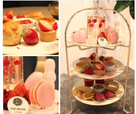
「Strawberry After“MOON” Tea」

【Bottom】オープンサンド ~ピーズのマッシュポテトとベビーリーフ~ / アポカドディップ / トルティーヤチップス / プティミッシュのサンドイッチ~生ハム・クリームチーズ・バジル~ / 苺スープ