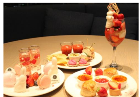
(右上)限定カクテル「Secret Gift」