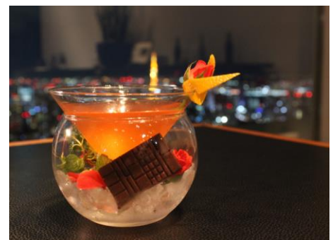
限定オリジナルカクテル「Secret Gift」