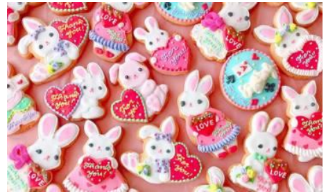
micarina バレンタインうさぎのアイシングクッキー

価 格： 594 円～864 円(税込) 場 所： 東京シティビュースーベニアショップ