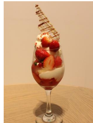
限定パフェ「Parfait aux fraises」