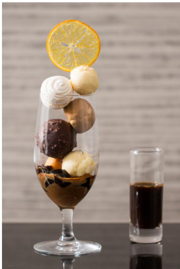
コーヒー好きのための濃厚アフォガートパフェ

提供場所: Cafe & Dining ZelkovA 提供期間: 2018年11月1日(木)～12月25(火)