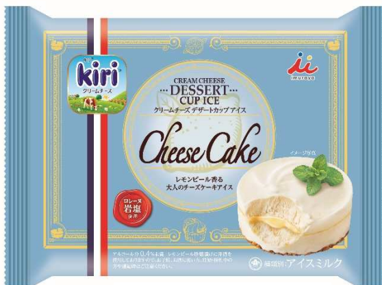
※商品画像はイメージです