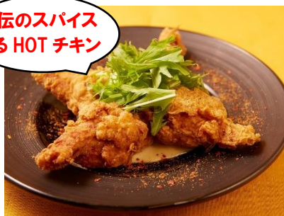
「悪魔の骨付きスパイシーチキン」 ¥1,296(肉屋 格之進 F) アークヒルズサウスタワー B1F

秘伝のスパイスミックスをたっぷり使った衣でパリッと焼いた骨付きのチキンに、さらにオリジナルスパイスをかけました。香ばしくジュシーな味わいとスパイシーな辛さがやみつきに！