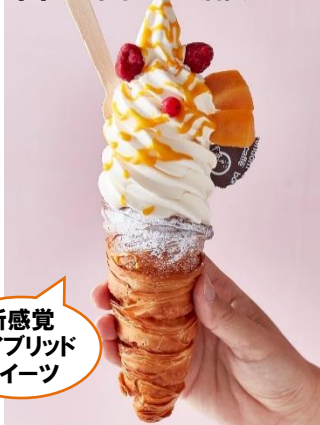
[1] 六本木ヒルズ店限定

今年のトレンドカラー“黄色”を配したスイーツが大集結！甘酸っぱいレモンやトロピカルなマンゴーなどのフルーツと、ソフトクリームやかき氷、スープなど、フォトジェニックなビジュアルが際立つメニューが目白押し。SNS映えも抜群です。