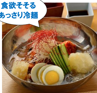
【左】「アボカド涼麺」ランチ¥2,000、ディナー¥2,160 (華都飯店)アークヒルズ 仙石山森タワー B2F

アボカドと巻き海老を使った夏にピッタリの冷麺。アボカドの風味と練り胡麻のコクを生かし、シンプルに塩で調えたまろやかなソースが秀逸です。揚げたカシューナッツと香草がアクセントに。