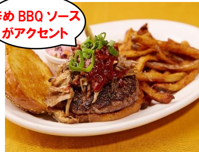
「BBQ プルドポーク バーガー」 ¥1,900(Bubby's New York ARK Hills) アーク森ビル 2F

豚の肩肉の塊を低温でスモークし、ほぐしたプルドポークを、100%ビーフのパティの上にたっぷりとのせたボリューム満点のハンバーガー。スパイスを加えて煮込んだ辛めのBBQソースはクセになる美味しさです。