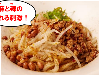
「鬼シビレ汁なし坦々うどん」 ¥970 (創作うどんとおでん居酒屋 あんぶく) 虎ノ門ヒルズ 4F

濃厚な胡麻ベースのタレに肉味噌、モヤシ、青ネギ、ピーナッツを合わせた坦々うどん。日本の青山椒、中国の花山椒の2種類の山椒を使用し、麻(マー)と辣(ラー)もプラス。辛さも4段階から選べます。