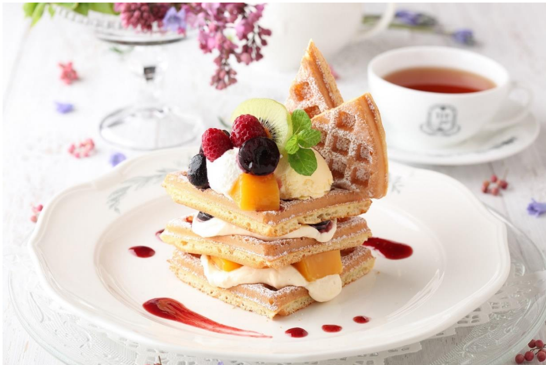
【フルーツミルフィーユワッフル】 ※新商品

紅茶とアメリカンワッフルを提供するカフェ「マザーリーフ」( http://www.motherleaf.jp/ )では、2018年6月21日(木)～2018年9月上旬までの期間限定で、「フルーツミルフィーユワッフル」を新発売します。同時に、「チョコミントアイスワッフル」や「パインモヒートティー」など、夏におすすめのメニューも登場します。