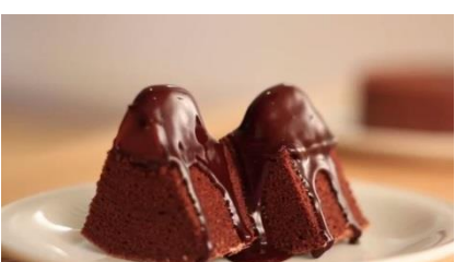
熱することで中央のチョコレートがとけ出します。