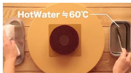
60°C くらいの熱湯でナイフを温めます。

( https://www.facebook.com/clubharie/videos/vb.249373375203985/825041430970507/?type=2&theater )