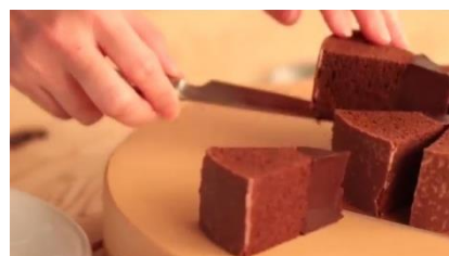
カットしたショコラバームをお皿に乗せます。