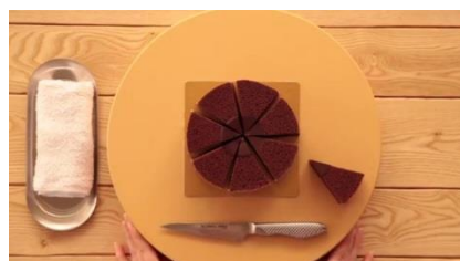
ショコラバームを放射線状にカットします。