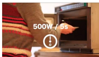
500W の電子レンジで約 5 秒熱します。